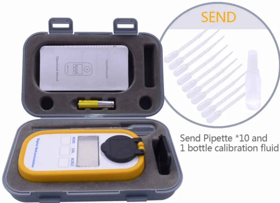
Send Pipette *10 and 1 bottle calibration fluid