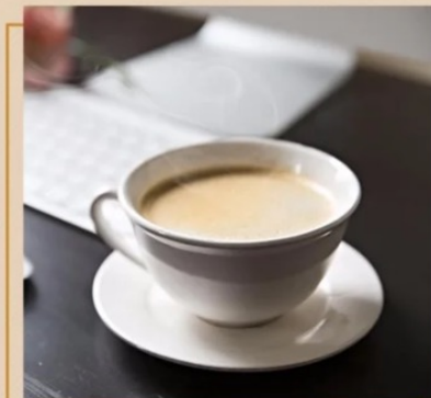
Tea with milk