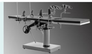
tabla de piernas

Estructura mecánica completa. Mantenimiento sencillo, baja tasa de fallos.