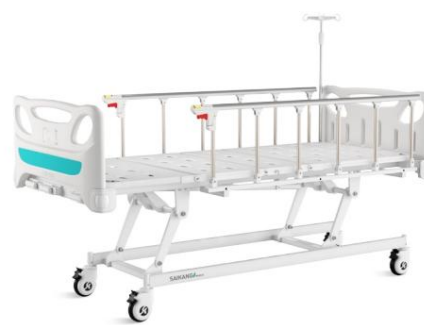
Ajuste de altura