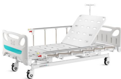
Ajuste del respaldo

La barra de infusión está fabricada en acero inoxidable y tiene cuatro ganchos de plástico que pueden soportar hasta 15 kg de peso.