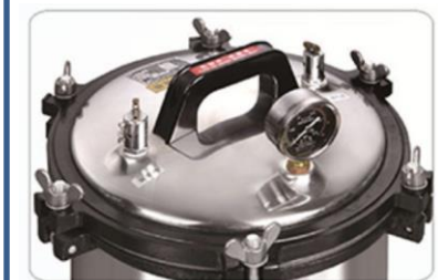
Tipo vapor a presión