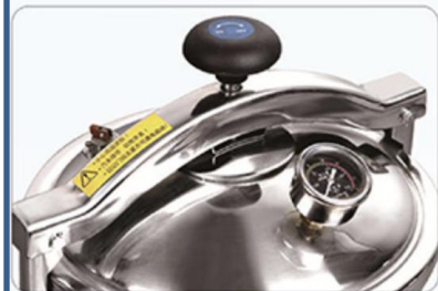
Tipo control de tiempo