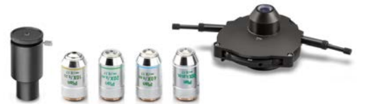
Condensador universal PH quintuple con 10×/20×/40×/100× Objetivos Plan-PH Infinito (set completo, Includido en OBN-15)