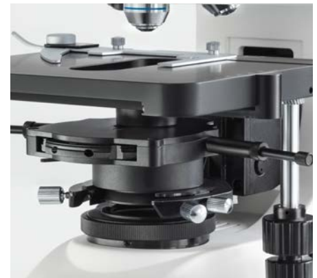
OBN-15: Condensador montado de contraste de fases