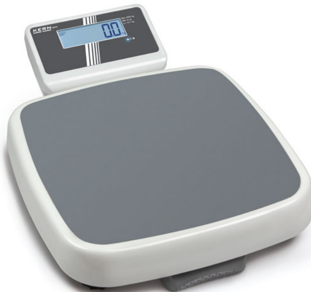
KERN MPD 250K100M

Balanzas pesapersonas Step-On profesional con aprobación de homologación y médica