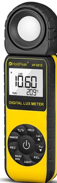
881D Light Meter