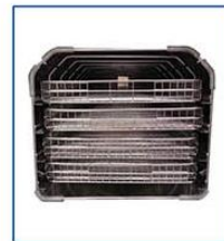
Type C (Optional for 45/60/80L)